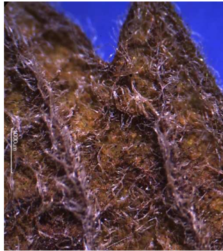
Lycopus europaeus s. str. Lycopus europaeus subsp. mollis